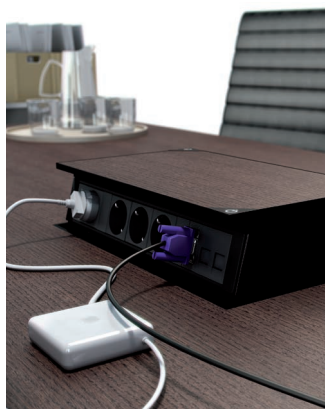
Meeting abierta. Open Meeting.