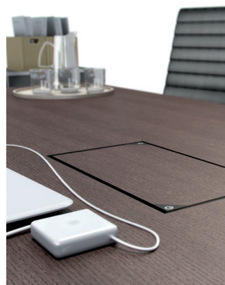
Meeting cerrada. Closed Meeting.