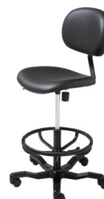
Hidráulica C/R (R) Hidráulica C/R (T) Hidráulica C/R-S (R) Hidráulica C/R-S (T)