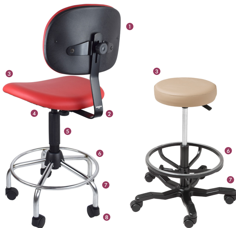
2.001 C/R (R) + suplemento (C)