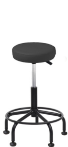
2.001 S/R (R) 2.001 S/R (T) 2.001 S/R-S (R) 2.001 S/R-T (T) Suplemento acabado cromo