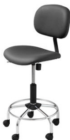
2.001 C/R (R) 2.001 C/R (T) 2.001 C/R-S (R) 2.001 C/R-T (T) Suplemento acabado cromo