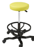
Hidráulica S/R (R) Hidráulica S/R (T) Hidráulica S/R-S (R) Hidráulica S/R-S (T)